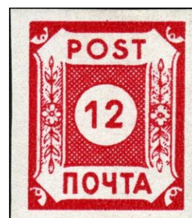
Abb. 3: B I b rot bis dunkelrot sog. „Ölfarbe“

Der Druck erfolgte im Rastertiefdruck auf weißem Kreidepapier ohne Wasserzeichen. Aufgrund fehlender Zähnungskapazität blieben die Bogen ungezähnt.