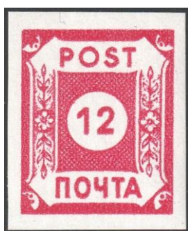
Abb. 1: B I a, hellrot sog. „Wasserfarbe“