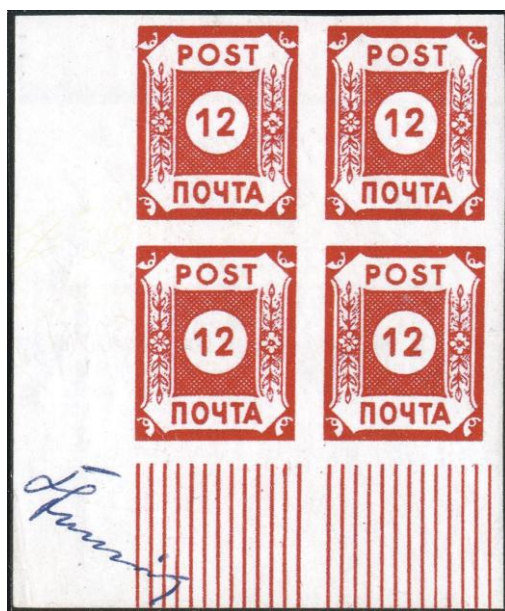
Abb. 2: B I b (4) mit Signatur des Entwerfers W. Chemnitz