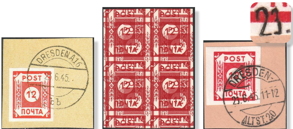
Abb. 4: Links: BI b mit Innendienststempel „DRESDEN A 16 23.6.45 bb“; nachgestempelte Fälschung