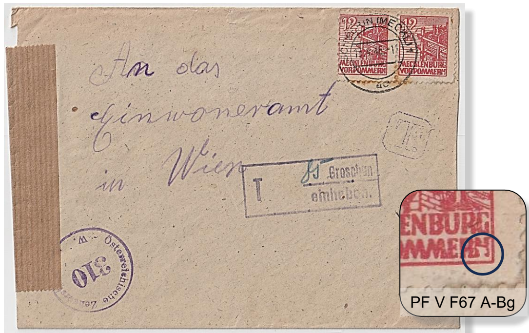
Abb. 1: Unterfrankierter Brief aus Schwerin nach Wien (ohne Länderangabe)